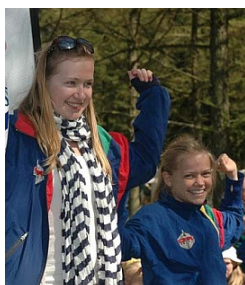
På podiet ved Påskeløb