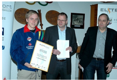
Hædres af Elite Sport Roskilde