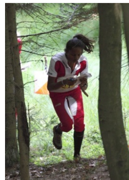
I landsholdstrøje ved Ungdoms-EM