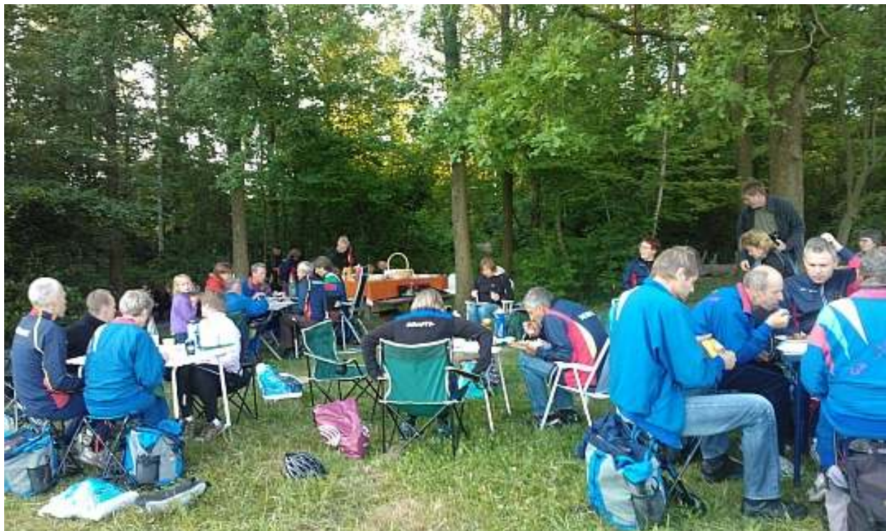
Sankt Hans løbet blev en fin afslutning på forårssæsonen med kagebord, grill og kurveløb. OK Roskilde er også en "Dining club with a running habit" - Og det er vigtigt!

Udfordringslisten er genopstået som løbende konkurrence og i hvert fald ajourført indtil medio maj.