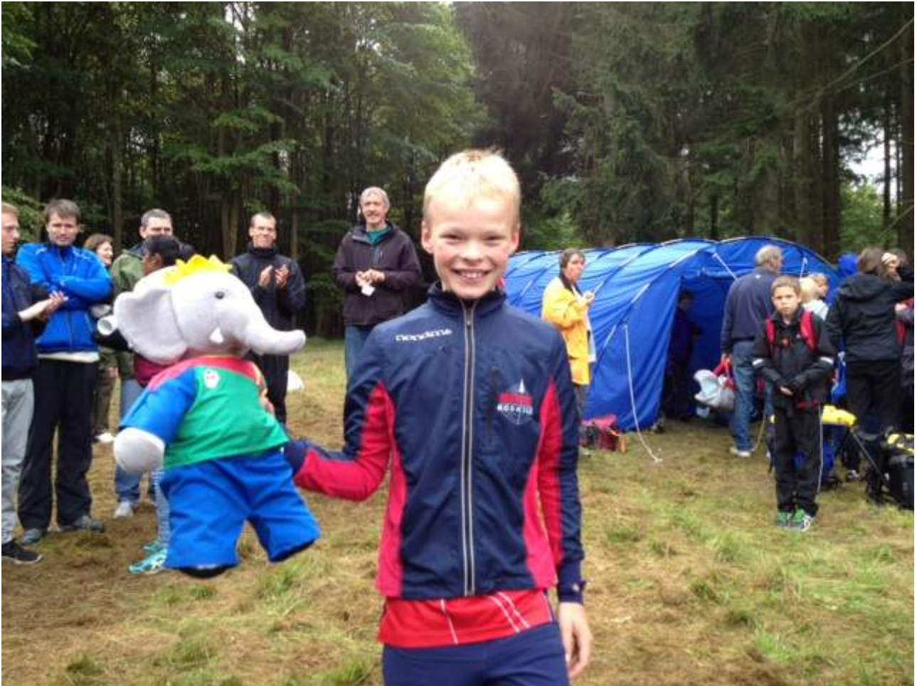
OKR's maskot kom på årets sidste divisionsmatch i pleje vinteren over – får han ny klubdragt i 2013?