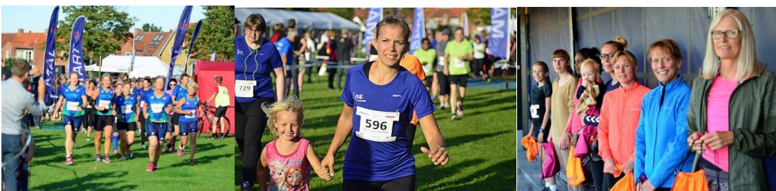
Stemmingsbilleder fra SMUK kvindeløb 2016.

I september blev SMUK kvindeløb afviklet fra havnen i Roskilde i det smukkeste sensommervejr man kan tænke sig. Under vejs kunne løberne nyde den smukke udsigt over Roskilde fjord; særlig flot var udsigten fra Skt. Hans. Lidt under 1000 kvinder stillede til start i årets SMUK kvindeløb, hvor der er både en 5 km og en 10 km distance. Det er lidt færre end sidste år, hvor godt 1400 løb den smukke rute, så tendensen med færre deltager ser ud til at forsætte; for bare 2 år side deltog 2000 kvinder. Nedgangen opvejes dog rigeligt at de mange glade deltager, så der er ingen planer om at droppe løbet foreløbigt.