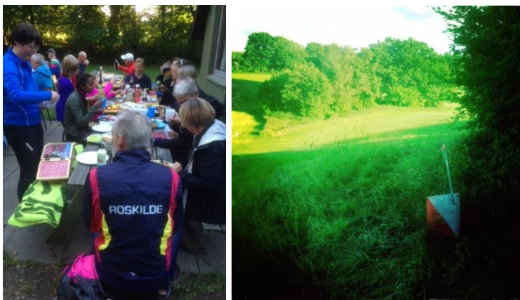
Stemningsbilleder fra Sankt Hans løbet

Årets Sankt Hans løb blev arrangeret i Særløse i et fantastisk forsommervejr.