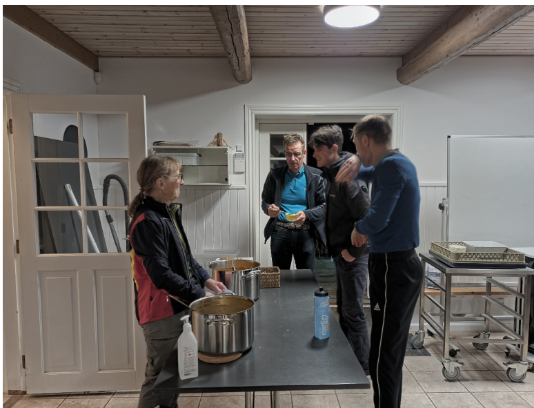
Forplejning ved natcuppen i november