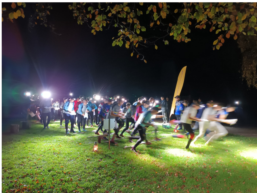
Starten ved natcuppen i november

En stor tak til alle der bidrog til at dette kunne lade sig gøre – jeg har kun hørt velvillighed til stille op og hjælpe.