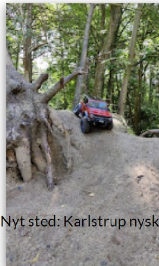
Nyt sted: Karlstrup nyskov