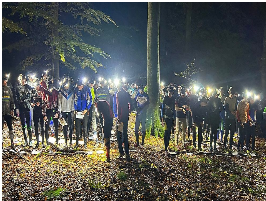
Stemning ved starten af natcuppen i november

Det er knapt så mange arrangementer end vi plejer og det skyldes, at løbsserien SMUK Kvindeløb er stoppet og at vi mod forventning rykkede ned i 3. division og derfor ikke kunne arrangere den 3-6. divisions match vi var udset til.